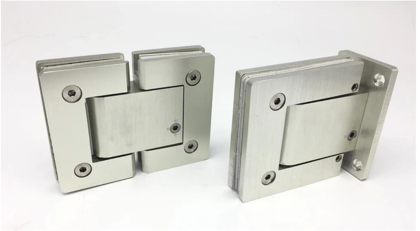
90 Degree Glass Shower Hinge in Stainless Steel & Aluminum Material: